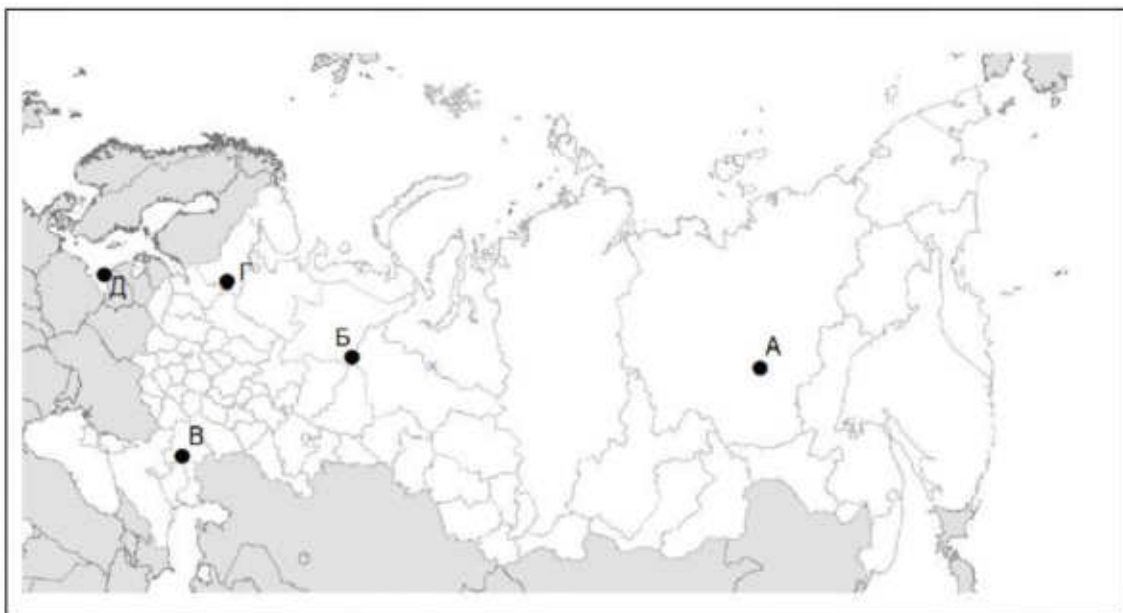
Рис. 1. Субъекты Российской Федерации