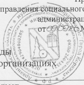
график проведения Олимпиады по предметам в общеобразовательных организациях

Приложение утверждён приказом управления социального развития администрации города от 09.09.20 № 453